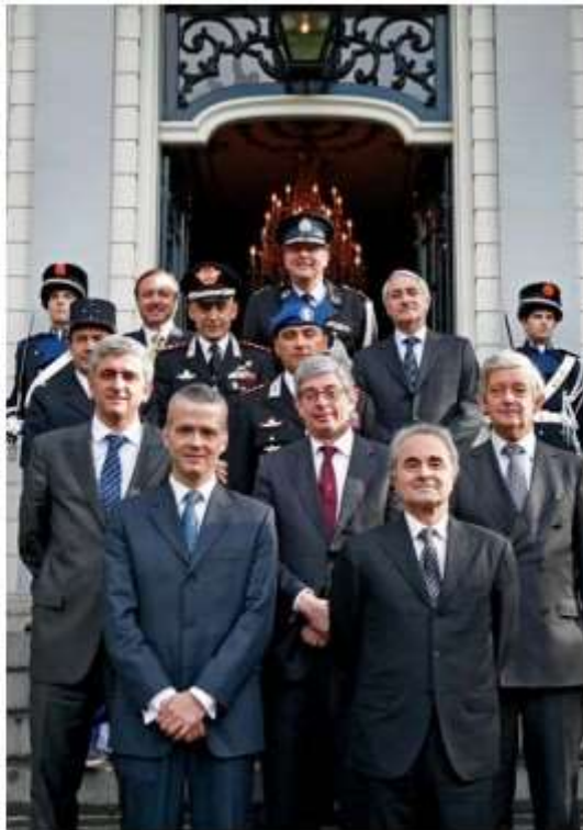
Ministers van de EGF-landen na de ondertekening van het verdrag

De voormalige Franse minister van Defensie, Alliot-Marie, drong al in 2003 (!) aan op de vorming van deze troepenmacht, nadat rellen van allochtone moslimjongeren in toenemende mate straatgevechten en plundering in Frankrijk tot gevolg hadden. EUROGENDFOR is alles: politie, strafrechtelijk onderzoek, leger en inlichtingendienst. De competenties van dit zootje ongeregeld zijn vrijwel onbeperkt. Het moet zorgen voor “veiligheid in Europese crisisgebieden”, in nauwe samenwerking met Europese militairen. De taak is vooral om opstanden de kop in te drukken. Steeds meer EU-landen treden toe tot Eurogendfor. Politici die toestaan dat bruto geweld gebruikt wordt tegen burgers. Ook dit heeft de EU tot het fascistische Vierde Rijk gemaakt.